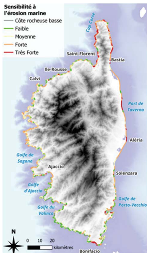
Figure 5. Cartographie de la sensibilité à l'érosion marine.

Sur la côte meuble, 59,5% du linéaire meuble présentent une sensibilité forte à très forte et correspond en majorité à des plages aménagées (voir Figure 5). La typologie a mis en évidence un contrôle important exercé par le caractère naturel ou urbanisé du cordon littoral. Les plages naturelles qui offrent un plus large espace d'accommodation, ont en majorité une sensibilité faible à modérée. Le linéaire le plus sensible est localisé sur la façade Est au niveau de la Plaine orientale (zones sous influence d'ouvrages côtiers et/ou d'embouchures, zones de dune urbanisée), des petites plages de poche aménagées du Cap Corse et du Golfe de Porto-Vecchio par ex. ainsi que localement sur des grandes plages de poche aménagées et exposées de la façade Ouest (Golfe d'Ajaccio, Calvi, Taravo-Tenutella par ex.). Ailleurs sur cette façade, le bilan est mitigé avec une sensibilité faible à modérée. Les plages les moins sensibles sont situées sur la façade Sud-Ouest (19% du linéaire).