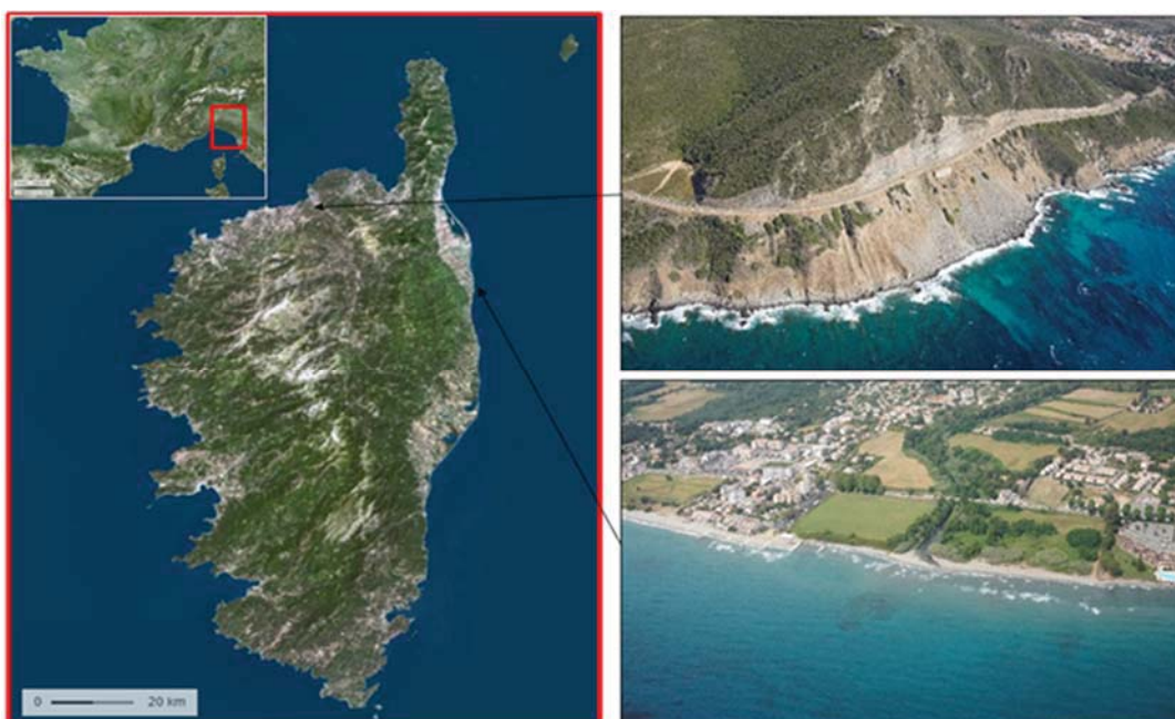
Figure 1. Localisation de la Corse (©Geoportail) à gauche et illustration des côtes rocheuses (en haut à droite) et meubles (en bas à droite), juin 2022.

Bien que la Corse dispose depuis 2001 d'un Réseau d'Observation du Littoral (ROL), la connaissance des évolutions géomorphologiques du littoral demeurerait trop partielle et hétérogène pour la mise en œuvre d'une Stratégie Territoriale Corse de Gestion Intégrée du Trait de Côte (STCGITC, BEZERT, 2019). C'est pourquoi, une méthode a spécifiquement été élaborée afin de compiler un grand nombre de données et de critères géologiques, géomorphologiques et hydrodynamiques, de manière homogène et la plus exhaustive possible à l'échelle des côtes meuble et rocheuse de l'île (environ 900 km, voir Figure 1). Appuyée notamment sur des analyses statistiques, l'interprétation de ces données a permis de cartographier la sensibilité à l'érosion marine sur la côte meuble (MUGICA et al. , 2022) et la côte rocheuse (GRELLIER et al. , 2022) au 1/25 000.