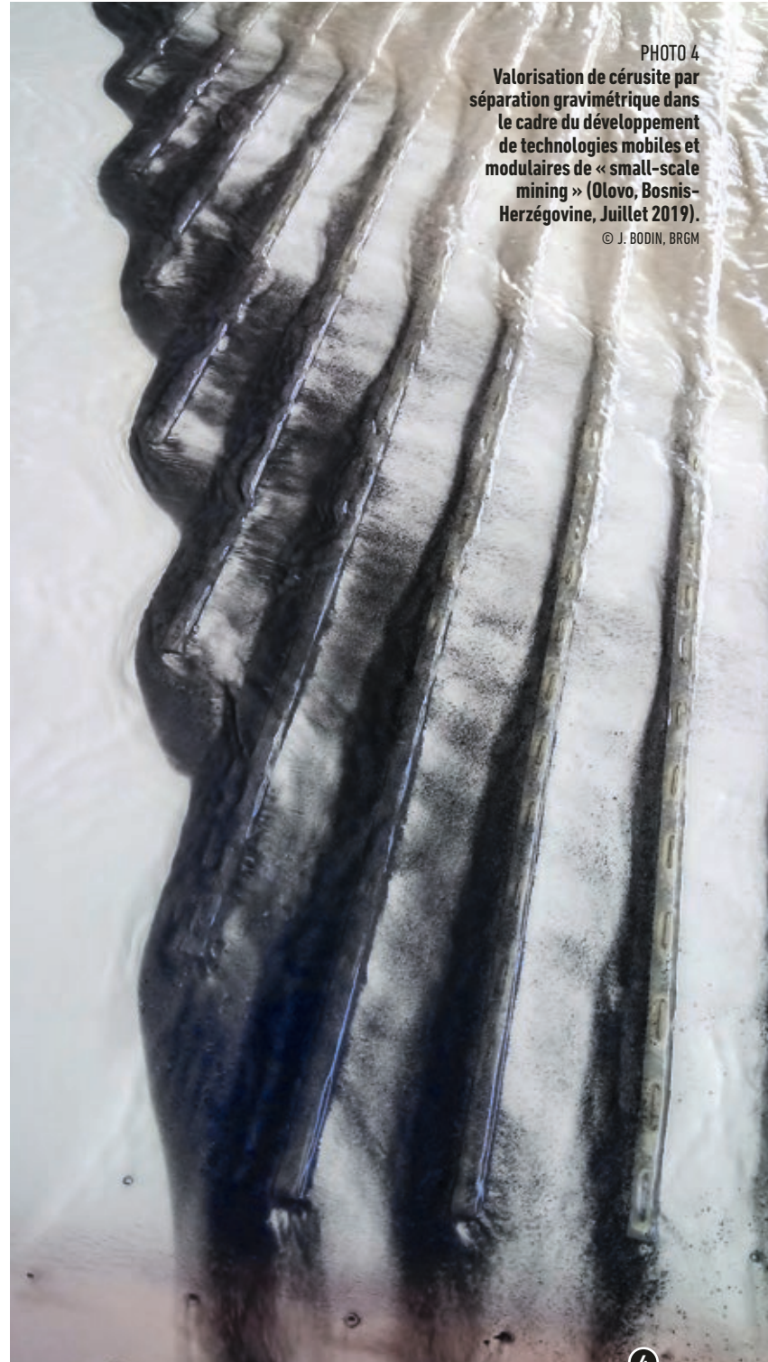
PHOTO 4 Valorisation de cérusite par séparation gravimétrique dans le cadre du développement de technologies mobiles et modulaires de « small-scale mining » (Olovo, Bosnis-Herzégovine, Juillet 2019).

La meilleure chance de voir aboutir un projet minier responsable et de garantir sa rentabilité sera de combiner les deux approches : coupler une bonne connaissance des caractéristiques physico-chimiques et spatiales du gisement avec la gestion dynamique opérationnelle du projet et l'anticipation des résultats prévisionnels, mais aussi des impacts potentiels et des risques. Ainsi, l'approche géométallurgique permet d'allier l'optimisation de la rentabilité des projets miniers avec la responsabilité sociétale et environnementale. C'est de nos jours d'autant plus indispensable que le développement des projets miniers n'est maintenant possible qu'avec l'assurance de garanties d'excellence et le consentement de la société civile consultée pour l'obtention des titres et autorisations d'exploiter auprès des autorités compétentes. ●