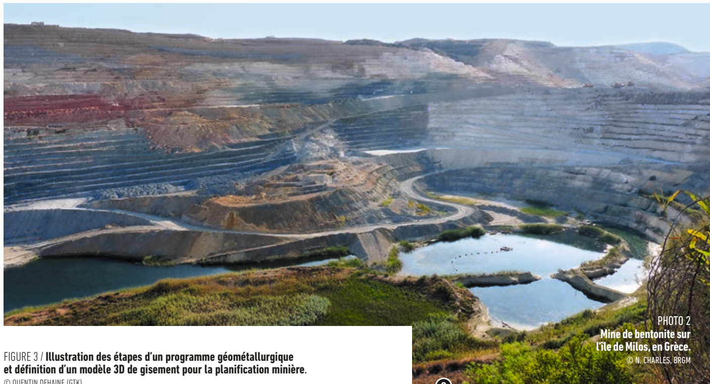
PHOTO 2 Mine de bentonite sur l'île de Milos, en Grèce.