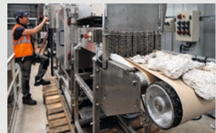
Un procédé de traitement à Plat'Inn.

Cette plateforme permet une grande flexibilité dans les études et se caractérise par la diversité des essais qui y sont menés – échantillonnage, comminution, séparations physiques et physico-chimiques, traitements thermiques, hydrométallurgie –, avec une forte composante sur la partie dissolution et la catalyse bactérienne, et par la diversité des objets qui y sont traités