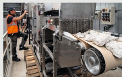
Un procédé de traitement à Plat'Inn.

Cette plateforme permet une grande flexibilité dans les études et se caractérise par la diversité des essais qui y sont menés – échantillonnage, comminution, séparations physiques et physico-chimiques, traitements thermiques, hydrométallurgie –, avec une forte composante sur la partie dissolution et la catalyse bactérienne, et par la diversité des objets qui y sont traités