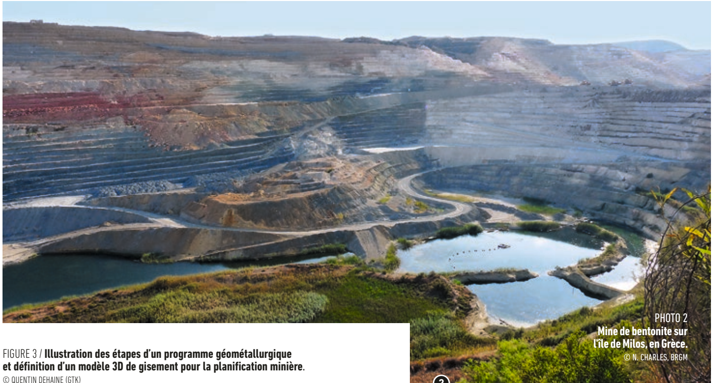
PHOTO 2 Mine de bentonite sur l'île de Milos, en Grèce.