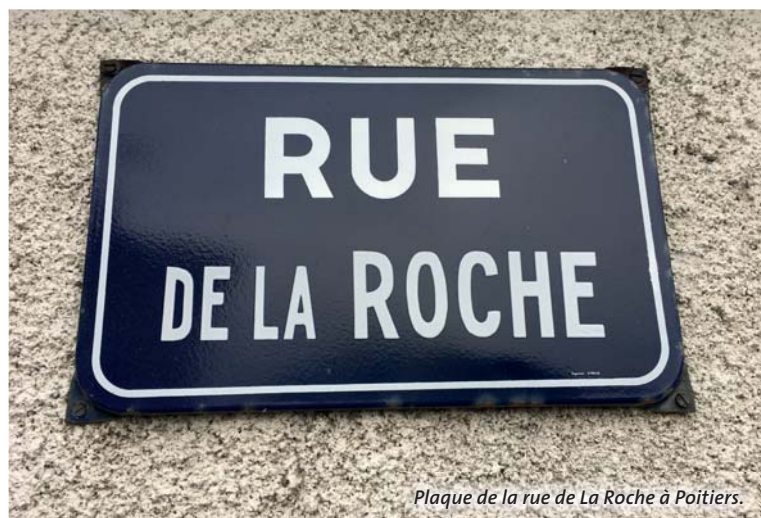
Plaque de la rue de La Roche à Poitiers.