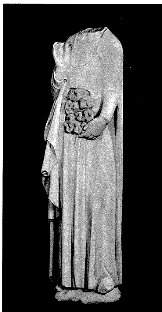
3. Statue de saint Mammès, Langres, cathédrale.

particulièrement adaptés à la polychromie : couleur blanche, grande homogénéité de grain, absence de défauts tels qu'inclusions minérales ou fossiles et, dans une certaine mesure, translucidité. La différence majeure est d'ordre chimique et minéralogique, puisque les marbres blancs sont des roches carbonatées, calcitiques, comme les albâtres égyptiens cités plus haut, tandis que les albâtres sont des sulfates. Pour le tailleur de pierre ou le sculpteur, cette différence minéralogique n'est pas sans conséquences, puisque les marbres blancs sont des roches beaucoup plus dures que les albâtres gypseux, et dans une moindre mesure que les albâtres anhydritiques. La finesse du grain n'est en rien un critère de distinction entre ces matériaux, marbres blancs et albâtres pouvant présenter des cristaux plus ou moins fins. La translucidité souvent