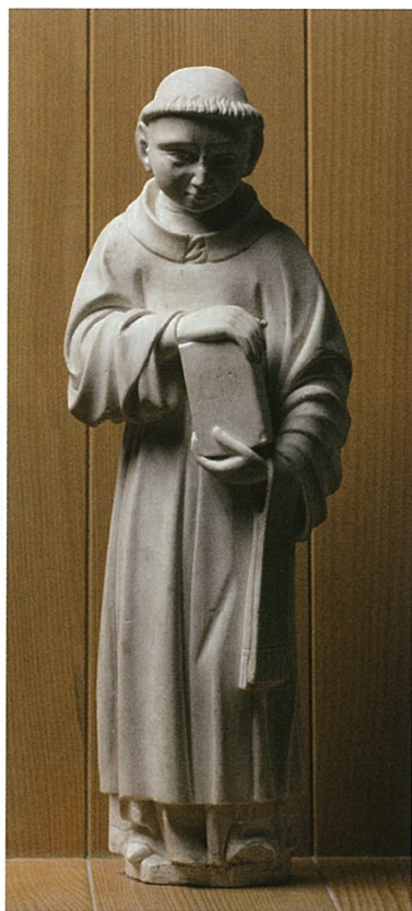
6. Diacre, élément du tombeau du pape Jean XXII, Avignon, musée du Petit Palais.