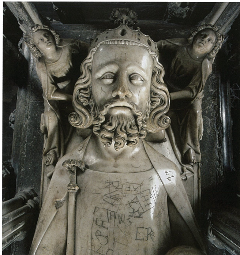
7. Tombeau d'Edouard II, Gloucester, cathédrale.

L'époque romane était en principe située en dehors de notre champ d'étude. Mais la question de l'origine de l'emploi de la carrière de Notre-Dame-de-Mésage nous a amenés à y faire quelques incursions. On constate ainsi sans surprise que cet albâtre a été employé localement très tôt, au moins dès l'époque romane (chapiteau d'Uriage, portail de l'église du prieuré de Vizille), mais également qu'il apparaîtrait, de façon plus étonnante, en Bourgogne, dans le tombeau de saint Lazare à Autun 26 (fig. 5). Ce monument, qui constituait le cœur de l'église de pèlerinage Saint-Lazare, était composé avec des matériaux très divers : pierres calcaires, notamment pour les grandes figures, marbres antiques de remploi 27 , mais aussi albâtre, donc. Même si la datation du tombeau a fait l'objet de nombreuses discussions chez les spécialistes, il n'en reste pas moins que l'œuvre appartient au XIII e siècle (probable-