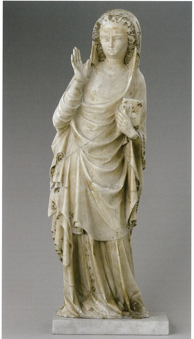
14. Groupe de l'Annonciation, la Vierge, Paris, musée du Louvre.

le fait d'avoir rencontré au contraire très majoritairement l'usage de l'albâtre dauphinois doit être expliqué – qualité du matériau? facilité de l'approvisionnement? –, de même que l'exception que représente le cas du tombeau d'Urbain V 37 (fig. 12).