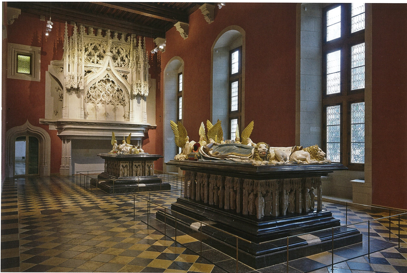
10. Tombeau de Jean sans Peur et Marguerite de Bavière et à l'arrière-plan tombeau de Philippe le Hardi, Dijon, musée des Beaux-Arts.