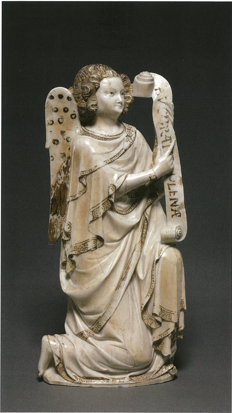
13. Groupe de l'Annonciation, l'ange Gabriel, Cleveland, Cleveland Museum.