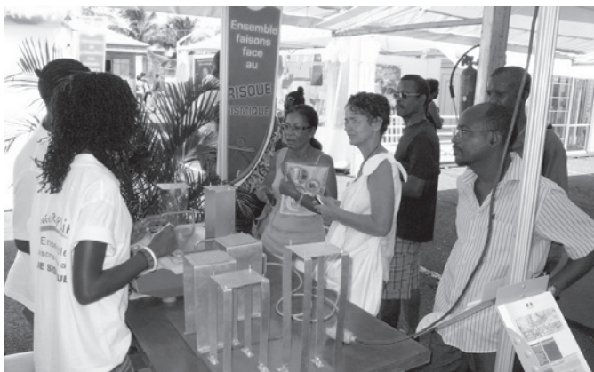
Kiosque d'information sur la construction parasismique par des étudiants en génie civil lors d'un salon de l'habitat (2009)

Des actions ont également été initiées dans les écoles avec la distribution de livrets illustrés, l'installation de sismomètres dans des lycées à des fins pédagogiques (réseau national « Sismos à l'École », www.edusismo.org ), ainsi que la tenue de conférences et d'exercices d'évacuation.