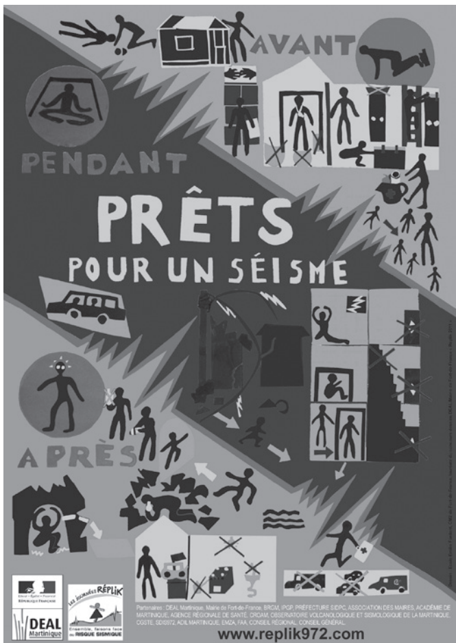
Affiche réalisée par des enfants concernant les consignes de comportement (2011)