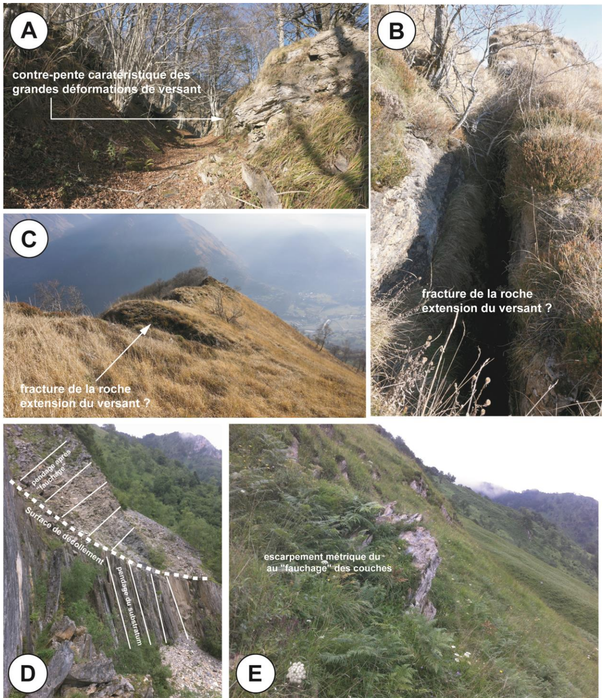
Figure 4. Indices caractéristiques de grandes déformations de versant sur le secteur de Geteu. A. Contre-pente marquant une déformation du versant avec extension de ce dernier. B. et C. Fractures ouvertes marquant une rupture dans les matériaux. D. Phénomène de fauchage caractéristique des déformations de versants taillés dans des matériaux schisteux. E. Manifestations topographiques de fauchage.