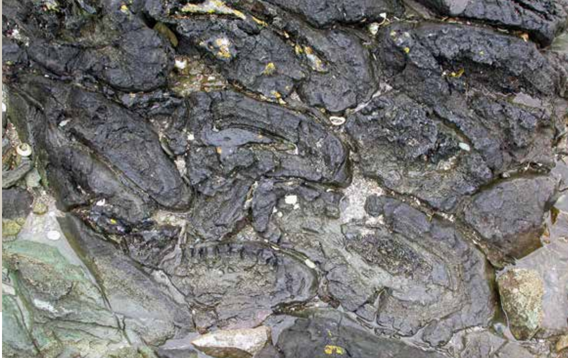
Fig. 1 : Coulées de lave à coussins d'âge protérozoïque. Pointe de Guilben (Paimpol, Côtes-d'Armor).

Fig. 1: Flows of pillow lava of Proterozoic age. Guilben Point (Paimpol, Côtes-d'Armor Department).