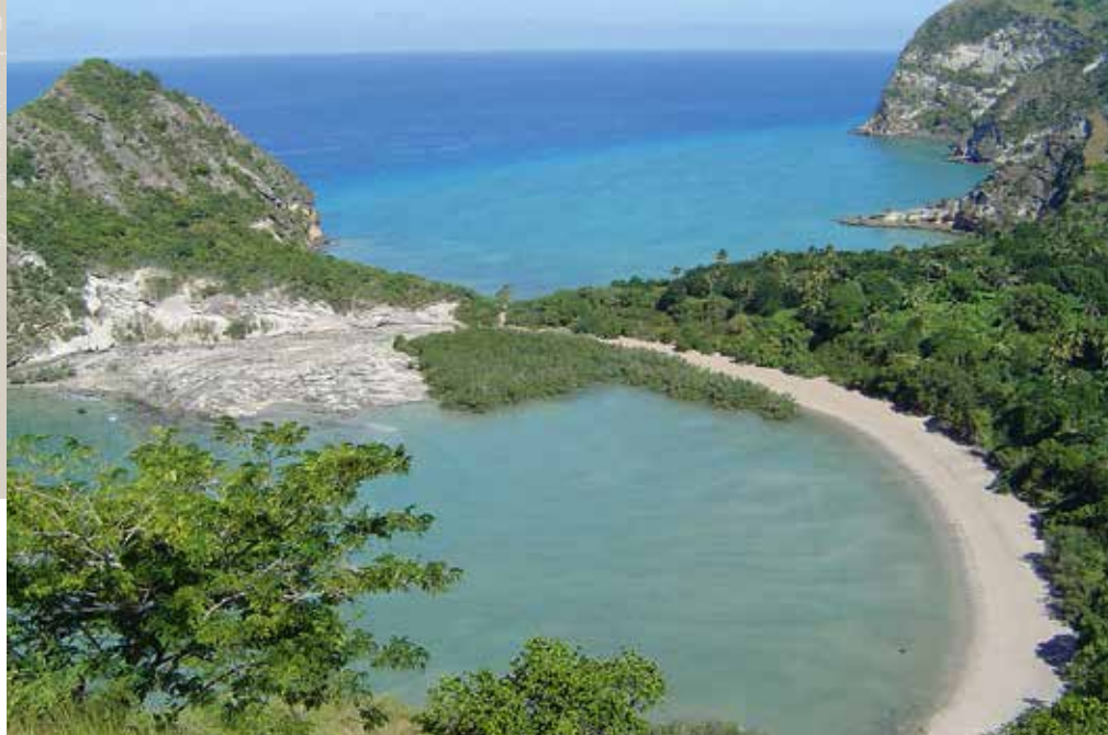
Fig. 9 : Les cratères volcaniques de Moya (Petite-Terre, Mayotte).

Fig. 9: The volcanic craters of Moya, (Petite-Terre, Island of Mayotte).