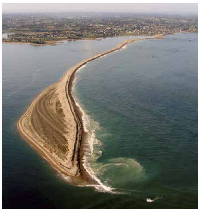
▶ Flèche littorale à pointe libre de la réserve naturelle régionale du sillon de Talbert (Pleubian, Côtes-d'Armor).

Sur le littoral français, seules trois réserves naturelles nationales (RNN) ont été créées spécifiquement pour un patrimoine géologique reconnu : (1) la RNN François Le Bail-île de Groix (Morbihan)-1982, [schistes bleus à glaucophane] ; (2) la RNN de la falaise du cap Romain, Saint-Aubin-sur-Mer-1984 (photo), [récif d'éponges bathonien ; blocs erratiques glaciels] ; (3) la RNN de La Désirade (Guadeloupe)-2011, [ancien fond océanique, arc fossile caraïbe]. Mais les réserves naturelles nationales de la dune Marchand (Nord), des estuaires picards (Somme), de la Baie