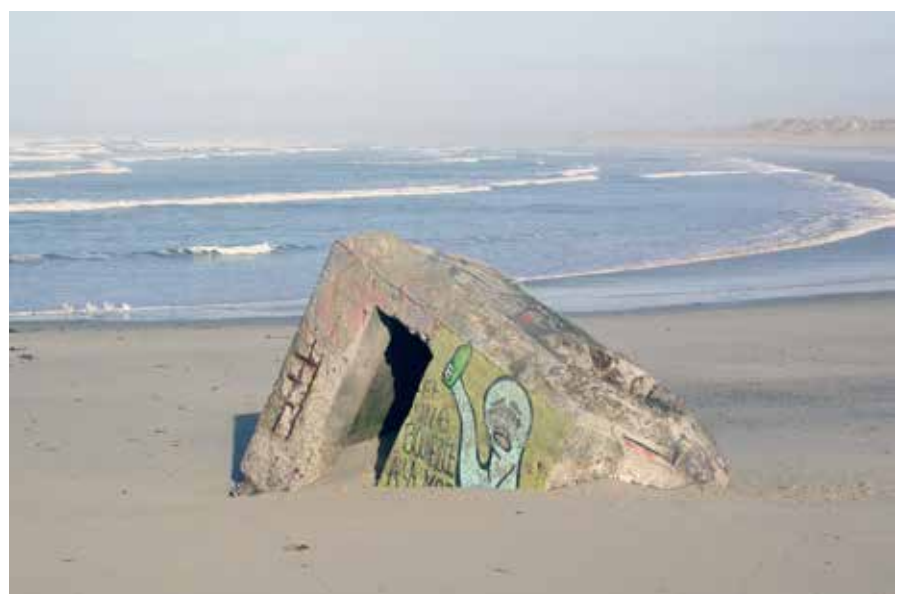
Fig. 11 : Restes d'un blockhaus de la seconde guerre mondiale aujourd'hui situés sur l'estran, à environ 60 mètres du littoral (Plomeur, Finistère).

Fig. 11: Vestiges of a blockhaus of the Second World War, located today on the foreshore, some 60 meters from the coast (Plomeur, Finistère Department).