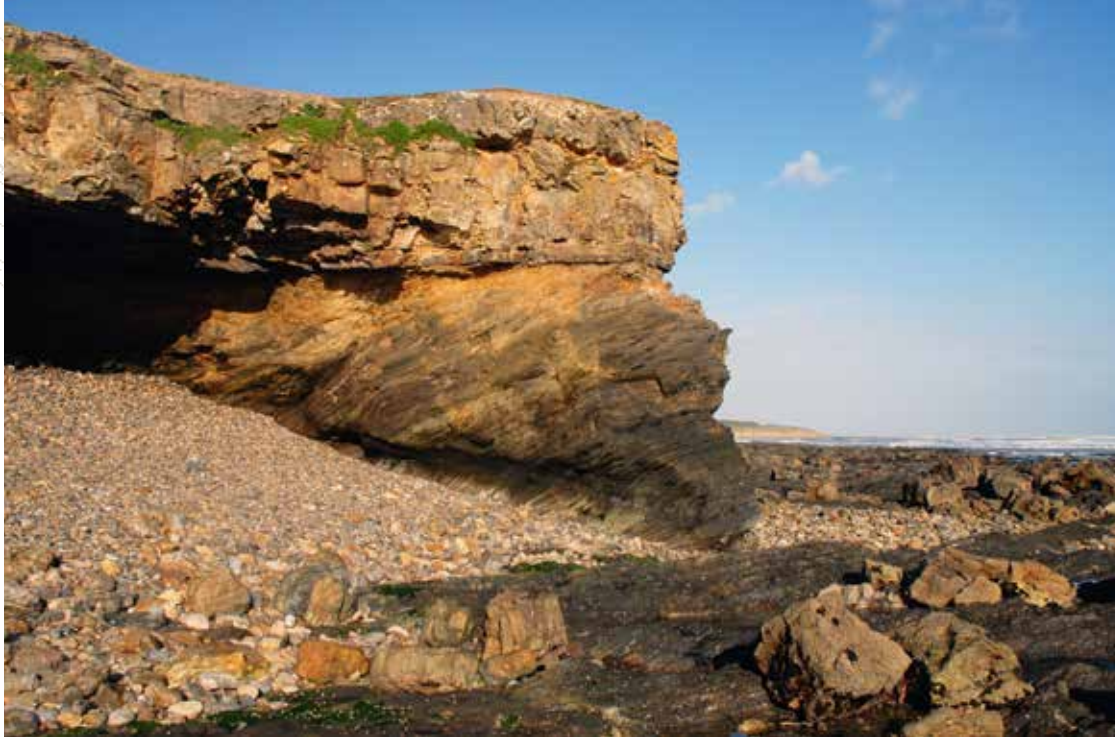
◀ Fig. 5 : Contact discordant entre les micaschistes du socle armoricain et les séries sédimentaires jurassiques (Jard-sur-Mer, Vendée).

Fig. 5: A discordant contact between micaschists in the Armorican basement and Jurassic sedimentary series (Jard-sur-Mer, Vendée Department).