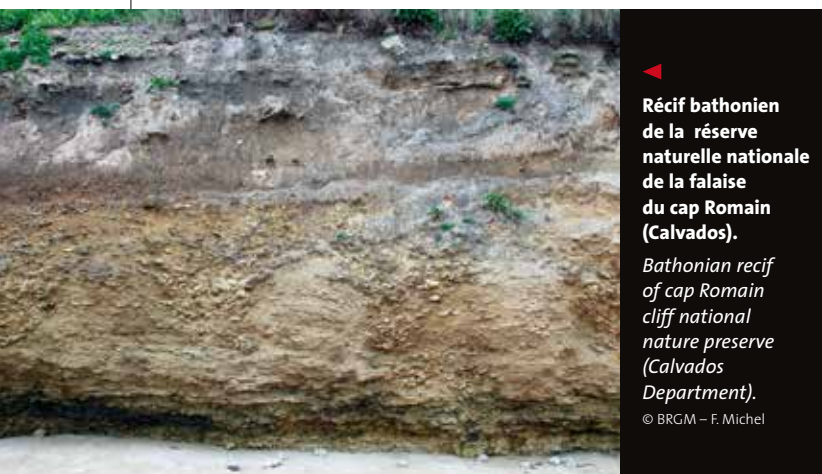
▶ Récif bathonien de la réserve naturelle nationale de la falaise du cap Romain (Calvados).

La géologie crée le paysage et se trouve très souvent à l'origine du caractère naturel, esthétique, pittoresque de nombreux sites : les falaises de Normandie, celles d'Erquy-Fréhel, la côte granitique de Ploumanac'h (Côtes-d'Armor), les pointes rocheuses de la presqu'île de Crozon (Finistère), la Mine d'Or de Penestin (Morbihan), la dune du Pilat (Gironde), la côte basque, la côte de l'Esterel, etc. Le littoral de France offre de nombreux sites naturels classés et/ou acquis sur fonds publics qui sont d'abord des lieux marqués par une géologie remarquable bien que rarement valorisée in situ . Si l'on fait un parallèle entre la protection des patrimoines biologique et géologique, on remarque que si les naturalistes ont su/pu dresser des listes de plantes, d'animaux, d'habitats à protéger pour leur rareté et le risque de leur disparition, de manière à mettre en œuvre les outils juridiques, rien de tel n'a encore été possible en géologie. Aujourd'hui, il est envisagé d'établir des inventaires régionaux de sites géologiques d'intérêt patrimonial qui auraient de fait une force juridique. L'inventaire national du patrimoine géologique a été lancé par le ministère en 2007 et est en cours dans les régions. ■