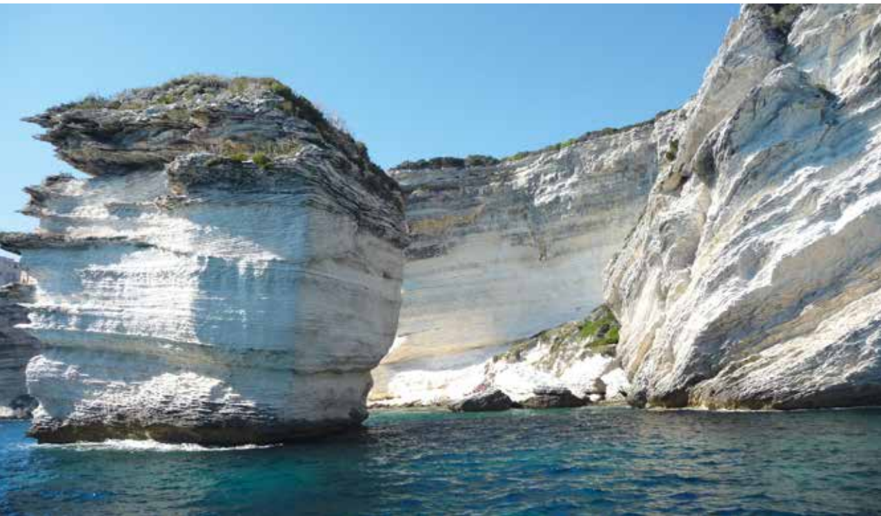
◀ Fig. 8 : Les falaises calcaires cénozoïques de Bonifacio (Corse-du-Sud).

Fig. 8: The Cenozoic limestone cliffs at Bonifacio (Corse-du-Sud Department).