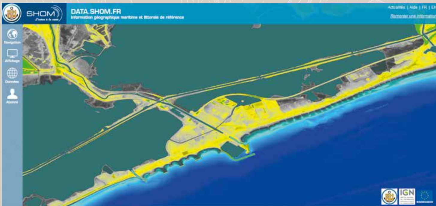
▲ Le produit LITTO3D (IGN-SHOM) : continuum topographique/bathymétrique de la bande littorale. Palavas-les-Flots (34).