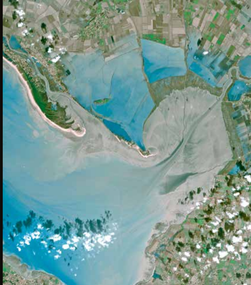
▲ L'anse de l'Aiguillon (Vendée), avant et après la tempête Xynthia (28 février 2010).

The Anse de l'Aiguillon, Vendée Department, before and after storm Xynthia (28 February, 2010).