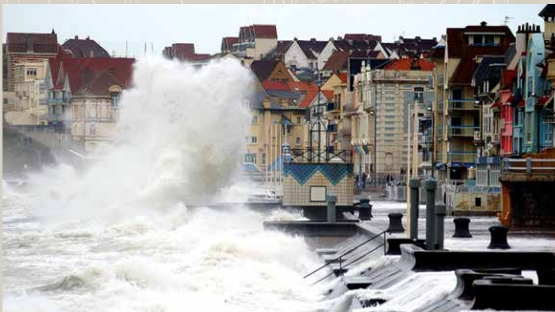
Wimereux, sur la côte d'Opale du nord de la France. Les vents forts de la tempête Johanna ont touché la région le 10 mars 2008, occasionnant aussi des dommages en Angleterre.

Wimereux, on the Opal Coast of northern France. Strong winds of Atlantic storm Johanna struck the area on 10 March 2008, also causing damage in the UK.