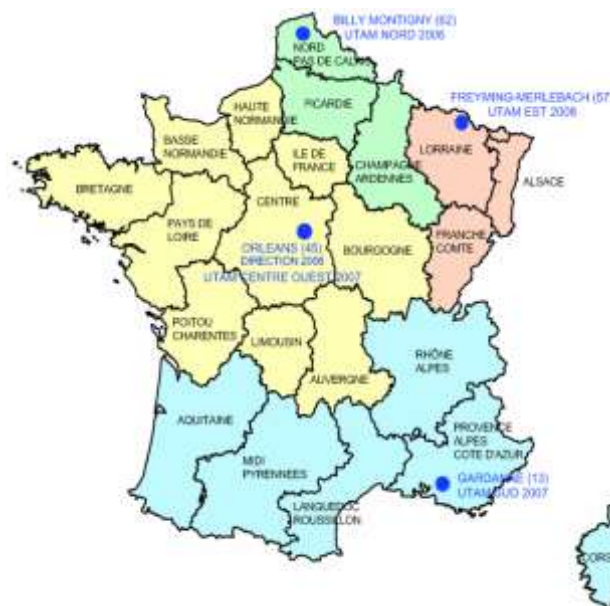
Figure 2 : localisation des 4 UTAM

Pour réaliser ces missions le BRGM a créé le 1 er mai 2006 le Département Prévention et Sécurité Minière (DPSM). Le DPSM dispose d'un effectif de 104 agents (données 2011) répartis sur 4 Unités Territoriales Après-Mine (UTAM) (Fig. 2)