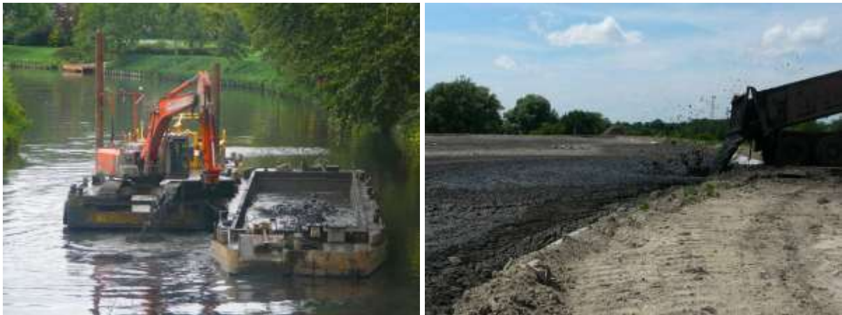
Figure 5: Curage non sélectif et mise en dépôt, Canal de Lens, 2010