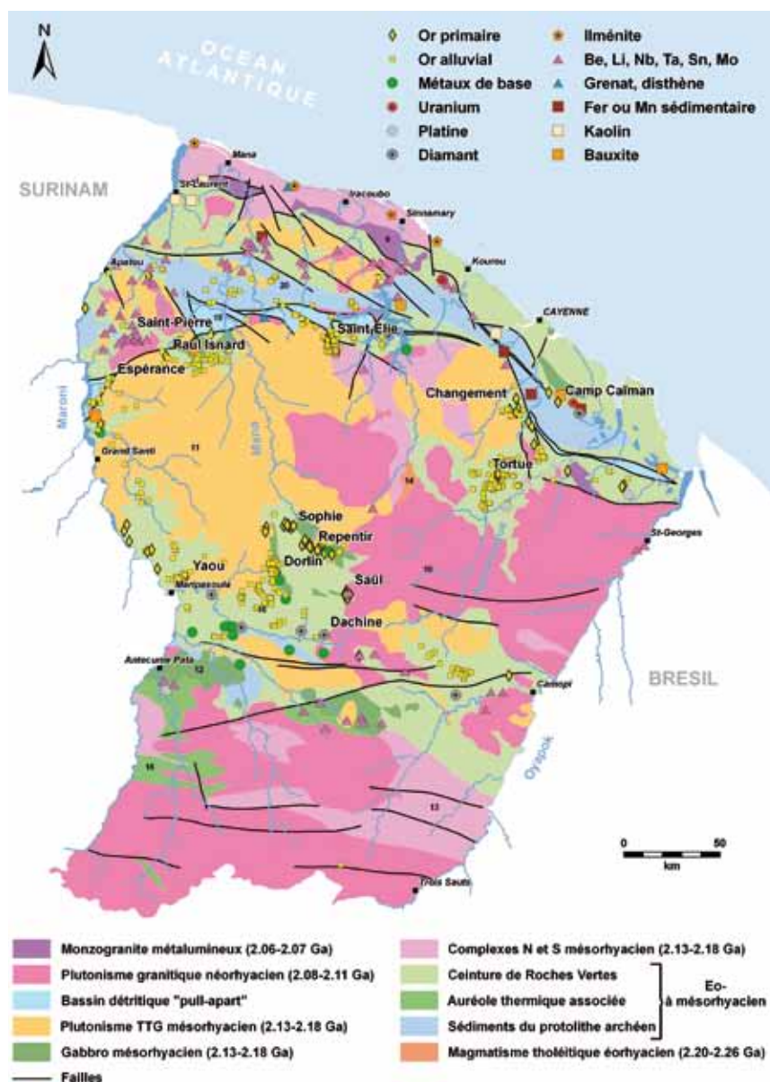
▲ Fig. 2 : Géologie simplifiée et ressources minérales de la Guyane.

“ La métallogénie du bouclier des Guyanes présente une évolution très similaire à celle du Birimien de l'Afrique de l'Ouest. ”