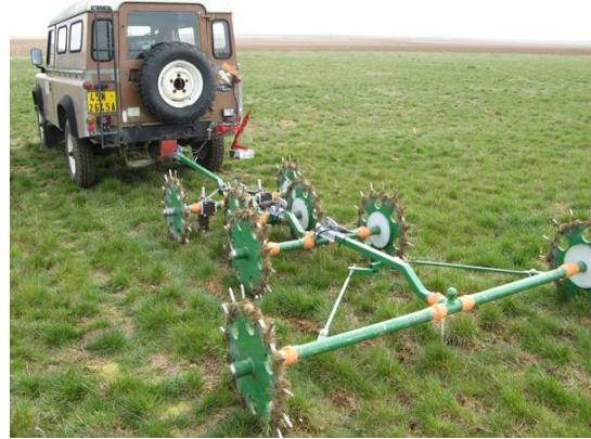
Fig. 1 – système GPR (gauche) et géoélectrique MUCEP (droite).

La partie traitement des données et algorithmique a consisté à identifier les meilleures solutions de filtrage et de transformation des signaux permettant d’aboutir à une interprétation fiable des mesures géophysiques enregistrés. Ceci a été particulièrement important pour traiter les données sismiques ou corriger les images hyperspectrales (Stevens, 2010), comme illustré sur la figure 2. Des algorithmes d’inversion furent finalement appliqués afin d’estimer les propriétés géophysiques expliquant les données. Ainsi, la stratégie de traitement proposée utilise plusieurs techniques, suivant la méthode envisagée :