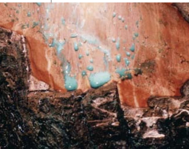
Latex coloré en bleu de l'espèce Sebertia acuminata .

La faune des massifs ultrabasiques (arthropodes, mollusques, reptiles), dépendante en grande partie de la flore, est également marquée par une forte endémicité. L'homme lui-même ne s'est pas établi à l'intérieur des zones ultrabasiques, seule la frange littorale étant de loin en loin occupée par quelques tribus. ■