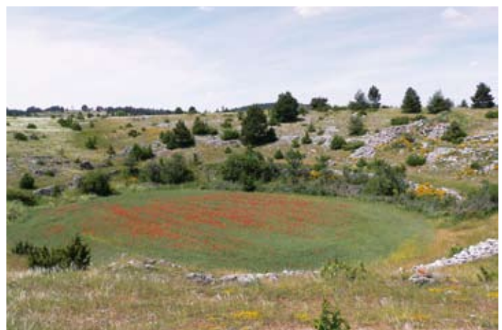
▲ Une doline, sur le Causse de Sauveterre, en Lozère.

A sinkhole on the Causse de Sauveterre (Lozère Department).