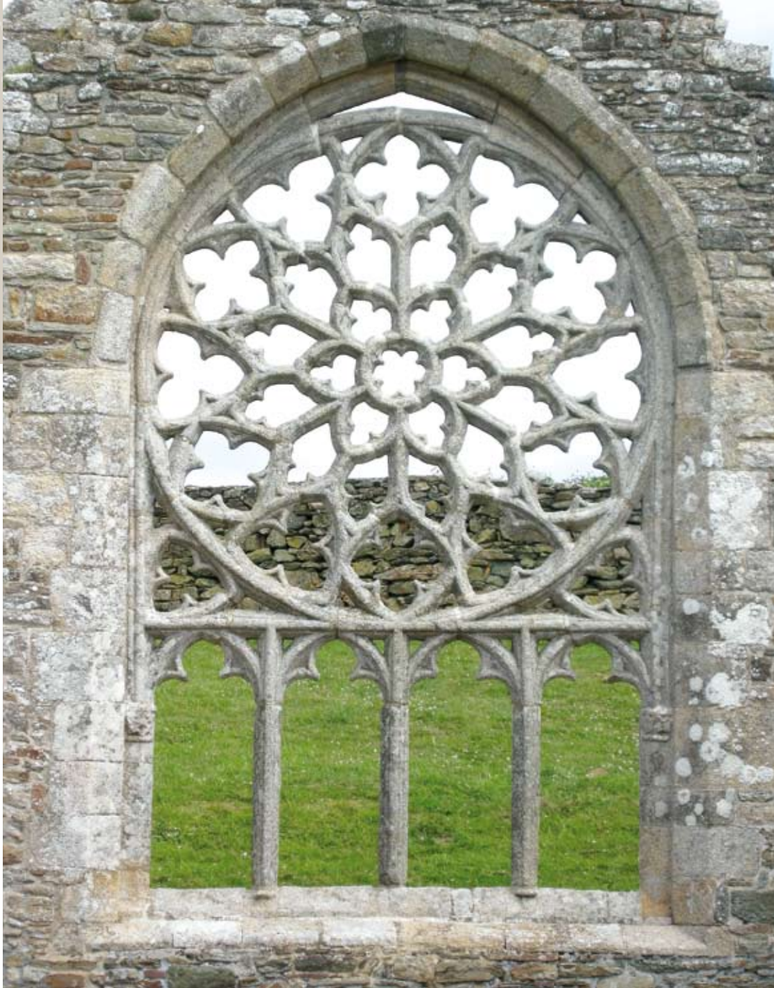
◀ Photo 1 : Murs en roches basiques métamorphiques et pierres ouvragées en granite des ruines de la chapelle de Languidou (Finistère) peuplés de lichens, colonies issues de la symbiose d'un champignon et d'une algue. On note une nette différence entre le peuplement lichénique du petit appareil de roches basiques et celui des roches plus riches en silice de la rosace.

Photo 1: Walls built of basic metamorphic rock and sculpted granite in the ruins of Languidou Chapel (Finistère Department), hosting lichens, symbiotic colonies of fungi and algae. A sharp contrast is observed between populations on the rubble masonry of basic rocks and those on the silica-rich elements of the rose window.