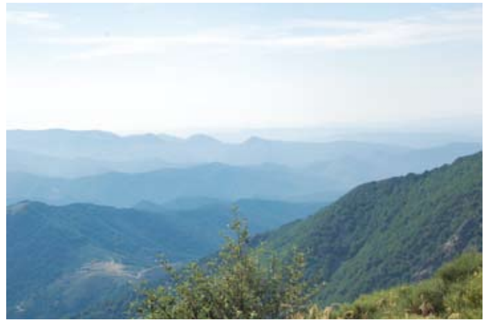
▲ Vallées cévenoles schisteuses, vue prise près du col de l'Aslié.

Schistose valleys in the Cévennes region, viewed from near the Aslié gap.