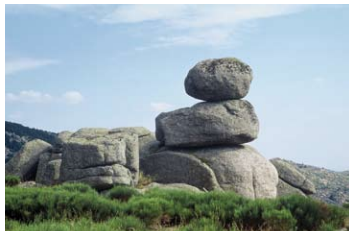
▲ Le chaos de granite du Mont Lozère.

The granite boulder field on Mount Lozère.