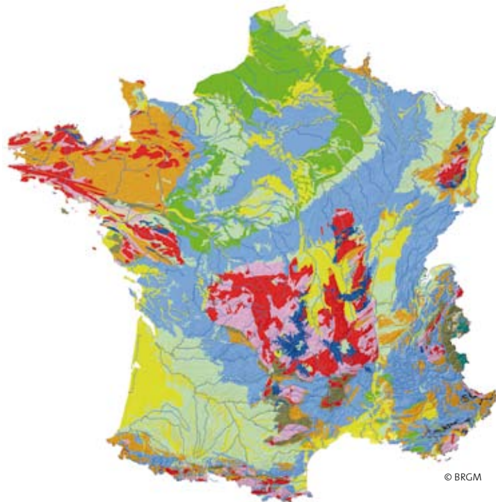
Fig. 1 and 2: Left, simplified lithological map. Right, simplified land-use map. Placed side by side, the two maps illustrate how land use is indeed significantly governed by geology.